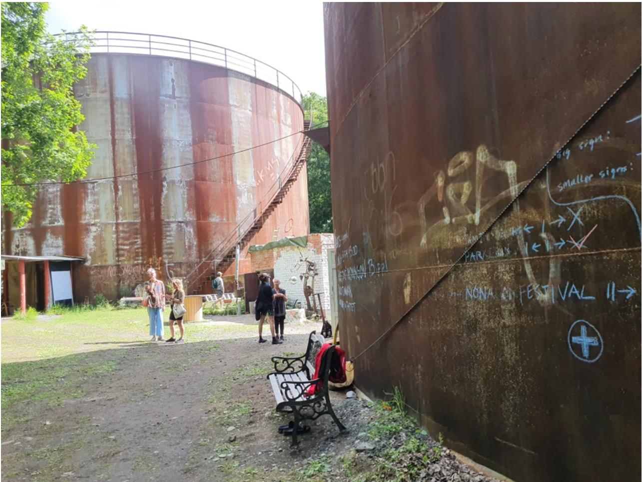
Cisternerna på Svanö.