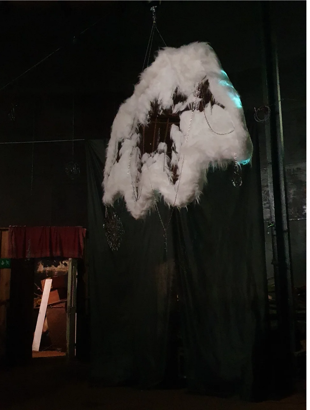
Spegelobjekt av Gabriela Prochazka.