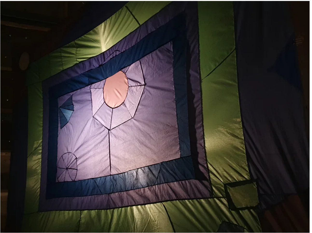
Textil av Nils Kristoffersson.