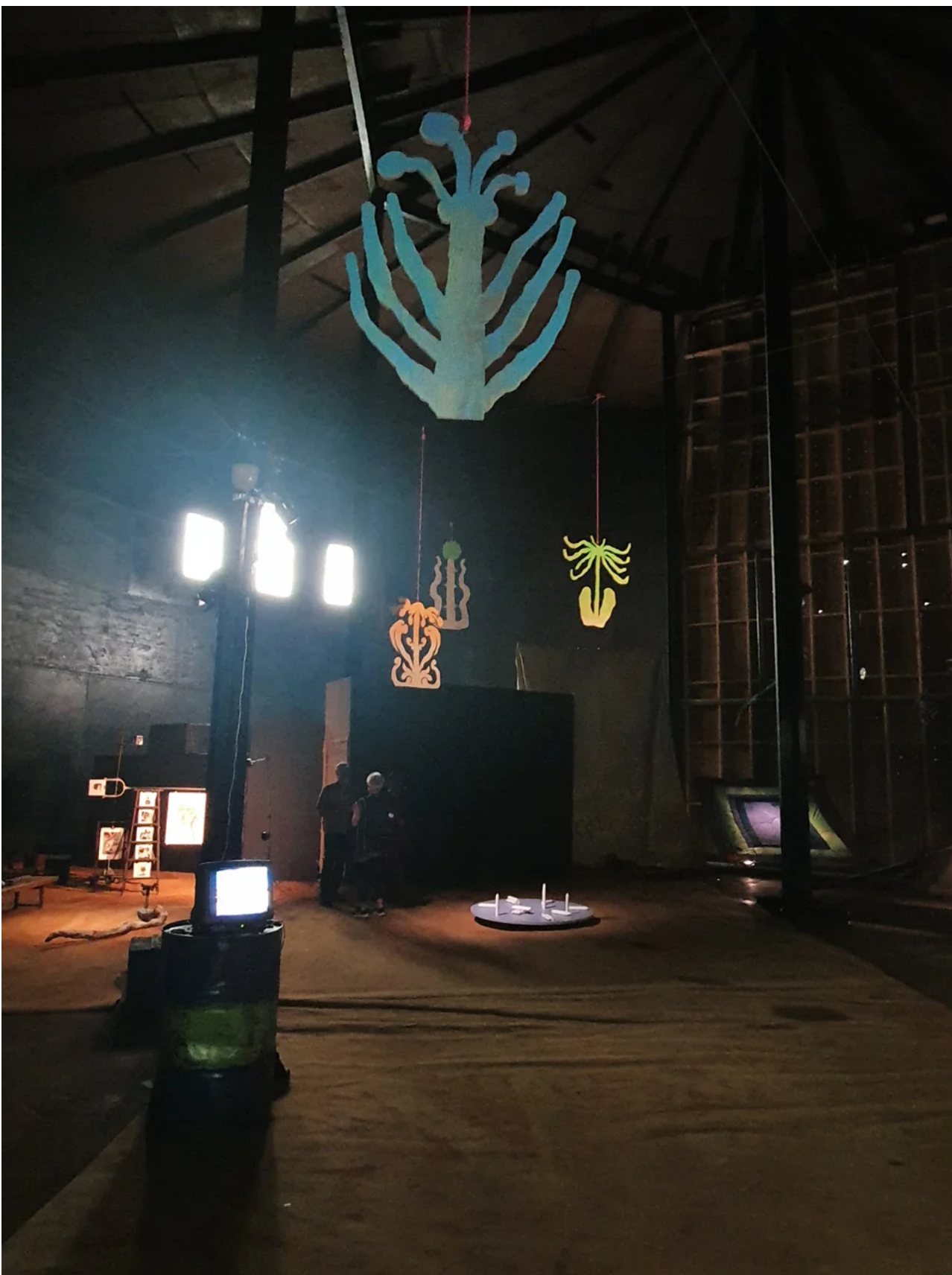
Utställningen i stora Cisternen.