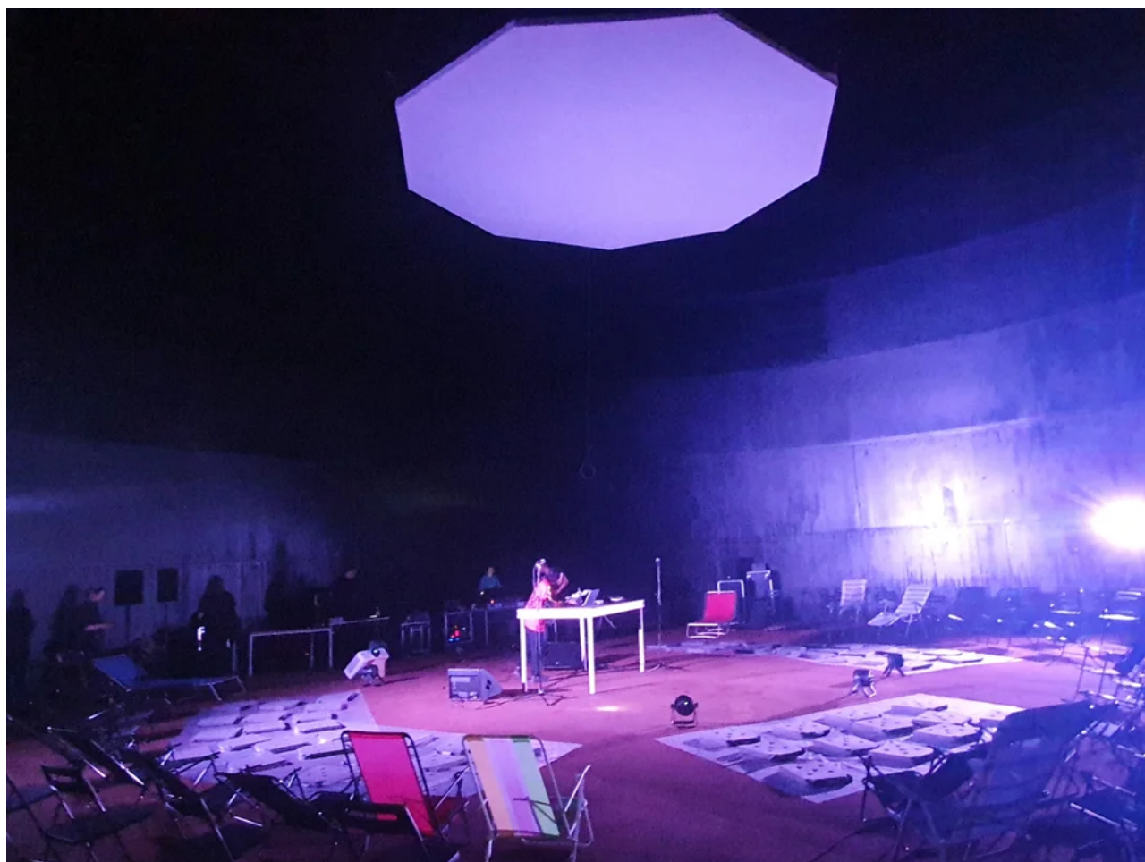
Soundcheck i Cisternen, uppe vid taket projektionsskärm.